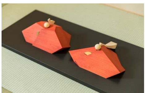
寄付金額 200,000円～ 商品番号 10020001 雛人形