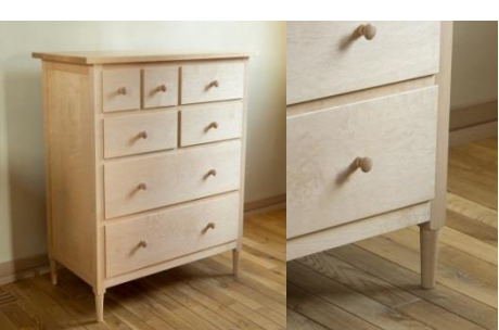
寄付金額 500,000円～ 商品番号 10050001 チェスト7DRAWERS