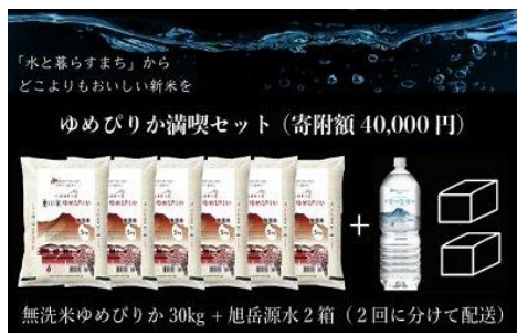
寄付金額 40,000円～ 商品番号 10003017 【一等米】「東川米」(無洗米) C：ゆめぴりか満喫セット