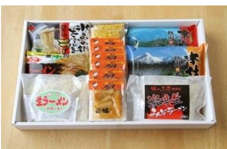
寄付金額 10,000円～ 商品番号 10001012 北海道「旭川ラーメン物語」 12食入り