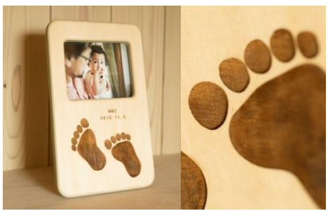
寄付金額 15,000円～ 商品番号 10001501 誕生を祝ったフォトスタンド (お子さんの足型刻印付き)