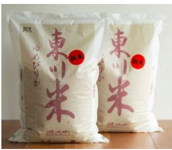
寄付金額 35,000円～ 商品番号 10003501 東川産特A米「ゆめぴりか」30kg (2回に分けて配送)