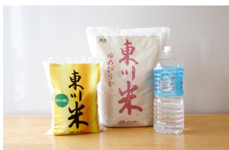
寄付金額 10,000円～(11月～3月) 商品番号 10001013 東川産特A米+旭岳源水セット ゆめぴりか5kg+ななつぼし2kg