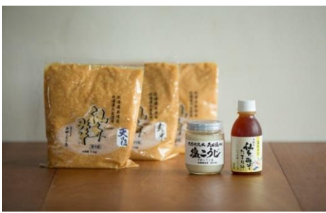
寄付金額 10,000円～ 商品番号 10001006 みそ食べ比べセット (塩麴・たまり汁付き)