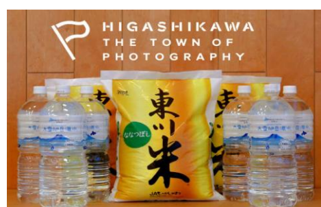
寄付金額 30,000円～ 商品番号 10003012 特A米ななつぼし30kgと大雪山旭岳 源水のセット(2回に分けて配送)