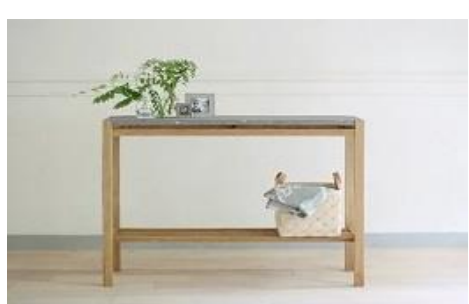
寄付金額 500,000円～ 商品番号 10100003 n'frame console table