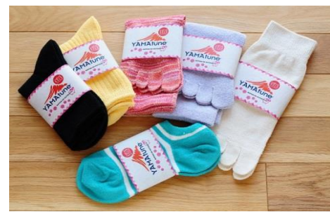
寄付金額 15,000円～ 商品番号 10001504 大地を感じるくつした(女性用)