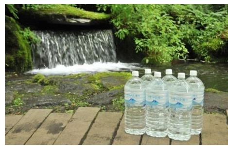
寄付金額 10,000円～ 商品番号 10001011 大雪旭岳源水(2L×18本)