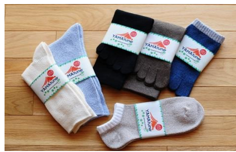
寄付金額 15,000円～ 商品番号 10001503 大地を感じるくつした(男性用)