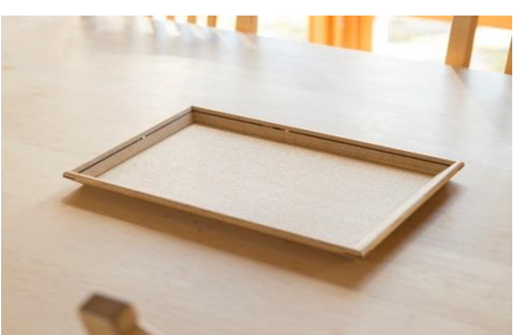
寄付金額 25,000円～ 商品番号 10002501 象嵌トレイ