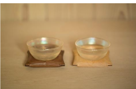
寄付金額 100,000円～ 商品番号 10005002 ぐい飲みセット