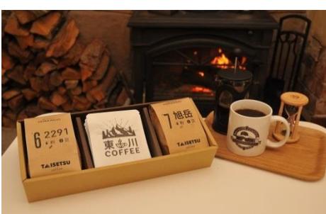
寄付金額 10,000円～ 商品番号 10001018 「ロースターコースター」 TAISETSU COFFEE セット