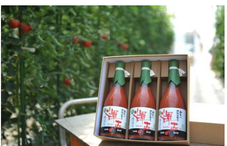
寄付金額 15,000円～ 商品番号 10001015 大雪山伏流水育ち 「輝赤」のトマトジュース