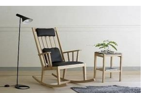
寄付金額 500,000円～ 商品番号 10100002 M-chair rocking