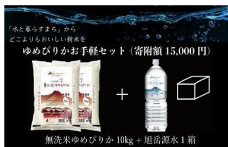
寄付金額 15,000円～ 商品番号 10003016 【一等米】「東川米」(無洗米) B：ゆめぴりかお手軽セット