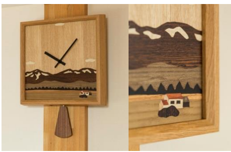
寄付金額 50,000円～ 商品番号 10002502 象嵌細工の時計