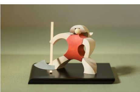
寄付金額 300,000円～ 商品番号 10030002 金太郎