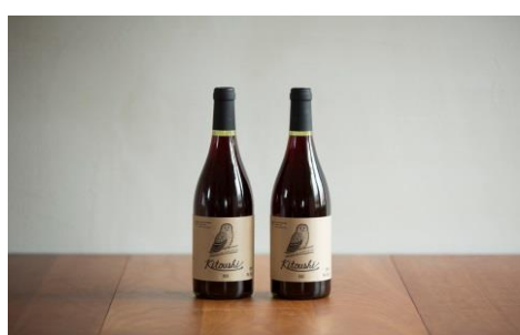
寄付金額 30,000円～ 商品番号 10003002 ひがしかわワイン 『kitoushi2016』※本数限定