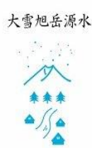
寄付金額 12,000円～ 商品番号 10001019 「水とくらすまち」から 大雪の天然水(500ml×48本)