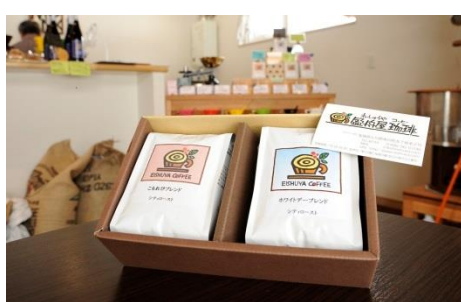
寄付金額 10,000円～ 商品番号 10001020 「盈舟屋珈琲」 オリジナルブレンドセット