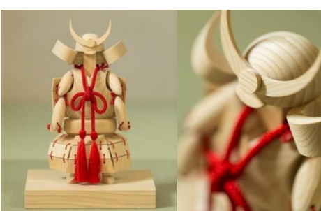
寄付金額 300,000円～ 商品番号 10030001 五月人形