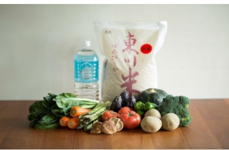
寄付金額 10,000円～ 商品番号 10001001 北海道ひがしかわ産農産物セット (11月～4月は米&水+加工品セット)