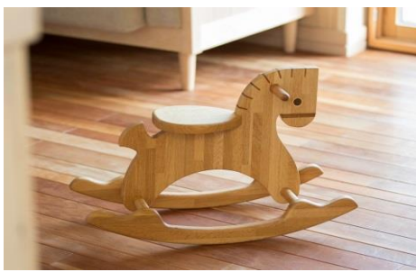
寄付金額 70,000円～ 商品番号 10007001 こども用木馬