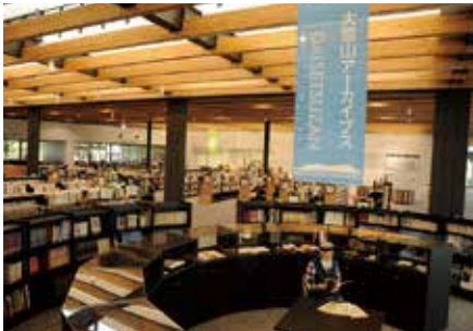
大雪山系に関する貴重な資料を集めた大雪山アーカイブス。「ほんの森」の書棚に取り囲まれるように、せんとびゅあIIの中心に位置している

注10) 3つの文化のうち、残る写真文化の拠点としては1989年(平成元年)11月にオープンした東川町文化ギャラリーがある。文化ギャラリーは本章執筆の2020年度(令和2年度)に開館以来初となる大規模改修に着手した。