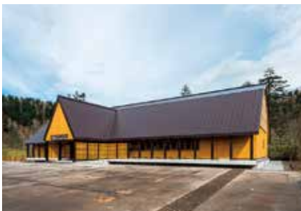
移転新築され2019年にオープンした旭岳ビジターセンター。大雪山系に関する登山情報の発信拠点として広く利用されている

せんとびゅあIIは図書館としての役割に加え、東川町が重視する3つの文化(写真文化、家具クラフトデザイン文化、大雪山文化)のうち、写真文化を除く2つの(注10)文化の拠点施設と位置付けられた。このうち家具クラフトデザイン文化については、織田コレクションの一部や町内家具メーカーの作品を常設した。