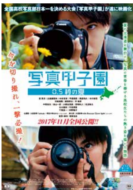
映画「写真甲子園 0.5秒の夏」のポスター

(注12)、菅原浩志氏は1955年(昭和30年)、札幌市厚別区出身の映画監督、脚本家、プロデューサー。代表作に「ぼくらの七日間戦争」(1988年)や「早咲きの花」(2006年)などがある。