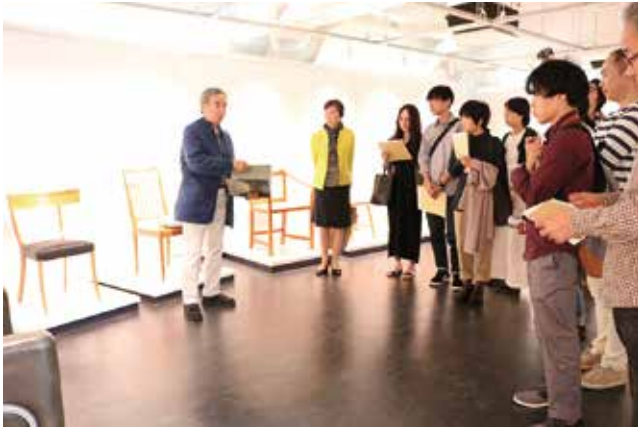
2018年6月の第34回東川町デザインスクール。 織田憲嗣氏（左端）が「スウェーデンのデザインとスウェディッシュ・グレイス展」と題して 解説した

ほか、著名講師の時には札幌や首都圏などからもわざわざ聴講に訪れる人があるなど、家具や家具デザインに携わる全国の関係者の間では「東京でもめったに聞けない著名デザイナーの話を、なぜか北海道の東川で聞くことができる」などと高い評価を受けている。