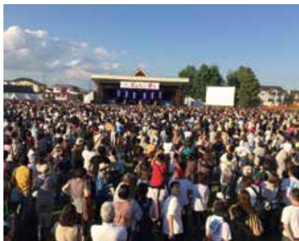
映画「写真甲子園 0.5秒の夏」の完成を記念して行われたライブ。羽衣公園が聴衆で埋まった

映画「写真甲子園 0.5秒の夏」は製作シネボイス（東京）、配給BS-TBS（東京）で、2016年（平成28年）5月の写真甲子園初戦審査会での撮影を皮切りにクランクインした。本戦大会直前の7月下旬には、町農村環境改善センターにエキストラの町民ら延べ約300人を集めたロケも行われた。