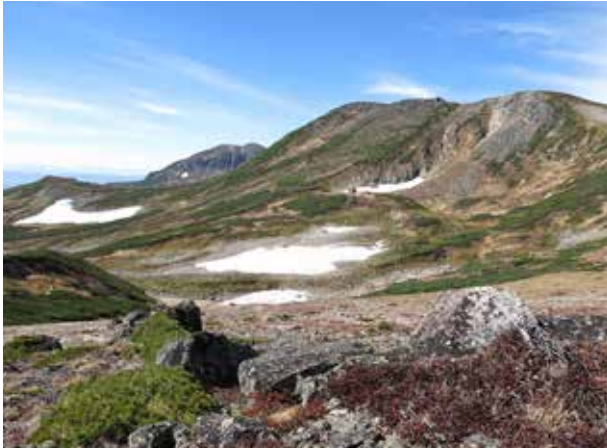
小泉岳 (2,158m) 付近から見た白雲岳 (2,230m)。山頂のやや下にある白雲岳遺跡は日本で最も高い場所にある遺跡だ

大昔の人たちが広範囲に移動していた痕跡が、やはり東川町内ではなく、そのすぐそばに眠っている。旭山動物園に代わって今度ははるか大雪山の山の上。旭岳山頂の東側に引かれた東川町との市町村境界線より、やや上川町側に入った標高2,120mほどの高地だ。ここに日本で最も高い場所にある遺跡としても知られる「白雲岳遺跡」がある