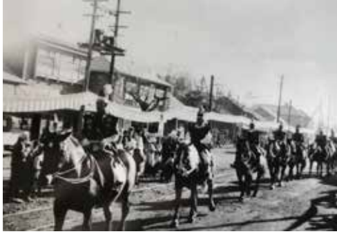
町制施行を記念して西4号市街地で行われた騎馬行進 =1959年（昭和34年）11月5日