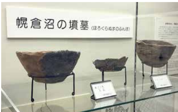
幌倉沼遺跡から出土した縄文土器

(注2) 参考までに、今から約2千年前ならイエス・キリストが生まれた西暦0年の前後だし、約2500年前なら中国で儒教の開祖である孔子が、または仏教の開祖であるガウタマ・シッダールタ(のちのブッダ、お釈迦様)が今のネパールで生まれたところに当たる。約3千年前となると紀元前1千年ごろとなり、中国の伝奇小説を基にした人気アニメ「封神演義」の舞台となった古代中国で、殷から周への王朝交代があったころとなる。