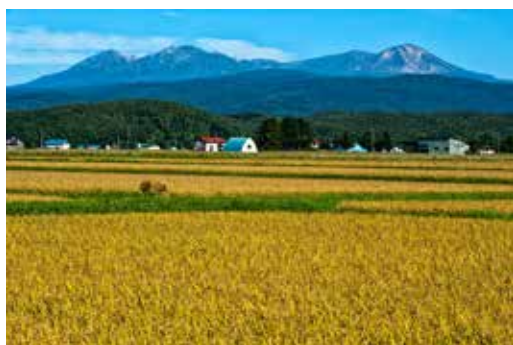
北海道最高峰の2,291mまで「成長」した旭岳（右端のピーク）。ふもとの東川町に豊かな実りと美しい景観をもたらしている

「北海道は歴史が浅い」といわれるが、実は和人が定住して以降の歴史が短いだけで、はるか昔からこの地には人が住み、その人たちがいなくなってもバトンをつなぐように次の人たちが暮らしてきた長い歴史があるのだ。