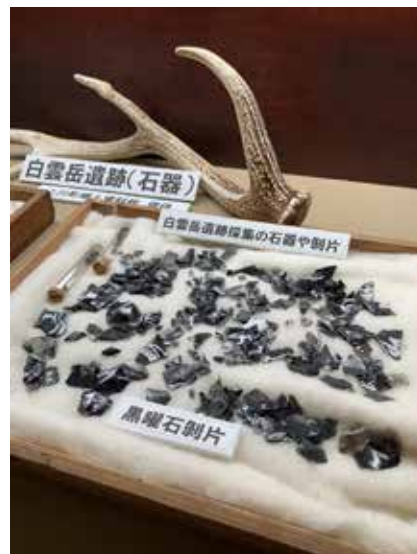
白雲岳遺跡で採集された遺物

これらのことから白雲岳遺跡に石器を遺した縄文人は、主に白滝、置戸といったオホーツク地方の住民で、旭川など上川地方や十勝地方の住民たちもごく少数だが訪れていたと考えられている。遺跡の近くには清水が流れる沢があり、縄文人が夏場に狩猟をした際の基地のような場所だったとも推測されているが、はっきりした理由は解明されていない。