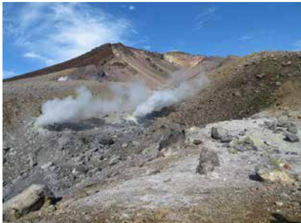
旭岳は大雪山系で最も新しく誕生した活火山。中腹には「地獄谷」と呼ばれる噴気孔群があり、活発な噴気活動が続いている

旭岳を形成することになった2万～1万5千年前からの噴火活動は、3万年前の大爆発後、カルデラ状になっていたお鉢平の西側で始まった。火口から噴出した溶岩流や火砕流などが積み重なって山体が少しずつ高くなり、何千年もかけて新たな山々ができた。歴史は旧石器時代から縄文時代へと移っていった。東川町のシンボルでもある旭岳は、大雪山系で最も新しく誕生した火山だ。