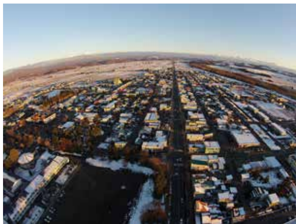
大雪山系の山々のふもとに位置する東川の地。豊かな水や森林に恵まれ、大昔から人が住みついできた

今回のコーヒーブレイクでは想像力も駆使して、東川の歴史の始まりを探ってみたい。本書の冒頭、第1章「ハブル崩壊を越えて」の前書きでも指摘した通り、旭岳のふもとに広がるこの地は古来、本質的に「移住者のまち」なのだ。