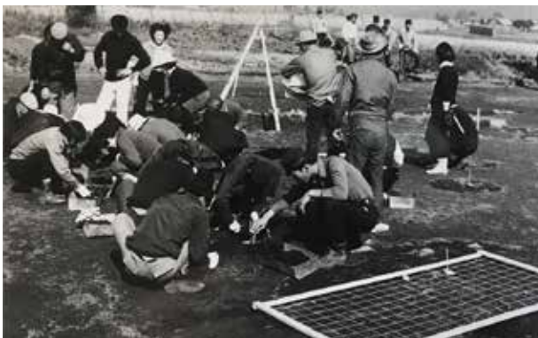
幌倉沼遺跡の発掘調査

本稿執筆の2021年(令和3年)時点で、東川町内に埋蔵文化財包蔵地(いわゆる遺跡)は23カ所ある。ただ、本格的な発掘調査が行われたのはこの幌倉沼遺跡と、1968年(昭和43年)の調査でやはり縄文時代晩期の共同墓地跡などが確認された西6号遺跡(西6号北10)の2カ所だけ。残る21カ所は発掘調査ではなく、遺跡分布に関する一般調査と呼ばれる簡易な調査しか行われていない。