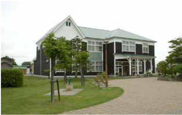
東川町役場そばにある郷土館。2階展示室では幌倉沼遺跡の遺物が展示されている

(注1)第1次発掘調査は1964年(昭和39年)10月15日～11月20日、東川町教委と北海道学芸大学旭川分校(当時)、日大旭川女子短大(同)の合同調査として行われた。その後、この場所が大規模圃場整備の対象に決まったため67年(昭和42年)10月7日～10日に、第1次調査から約200m離れた場所で急ぎ第2次発掘調査が行われた。結果は調査報告書「幌倉沼の墳墓」(東川町教委)にまとめられた。