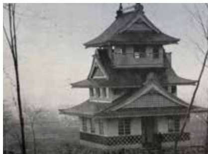
大規模圃場整備事業を記念して1975年(昭和50年)10月に完成した展望閣

(注6)1961年(昭和36年)の農業基本法制定を受け、明治時代の入植以来無秩序に広がっていた狭小な水田や畑を全町的に掘り直し、30アールずつに区画整理し直した。総事業費は約50億円、総面積は約3千ヘクタールで、1974年度(昭和49年度)に完了した。