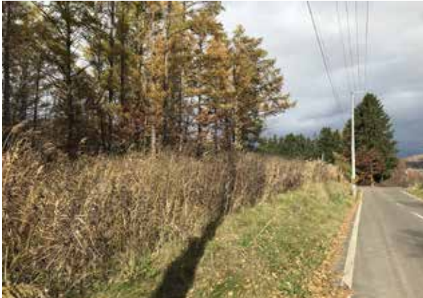
倉沼2遺跡がある旭山動物園そばの雑木林

旧石器時代は氷河期だった。氷河期も比較的温暖な時期と寒冷な時期を繰り返したが、最終氷期と呼ばれる約7万年前から縄文時代が始まる直前までは特に寒かった。地球上の水が大量に凍ったため、海面は今より100m以上も低かった(注4)。