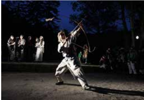
山開きに合わせて毎年6月、旭岳温泉で行われている「旭岳山のまつり」。山の神に祈るヌプリコロカムイノミが祭りのメインだ

(注7) 郷土史「ふるさと東川」(1994年刊)の第1巻創生編330ページには、古老による入植当時の思い出話として「(開拓地に入ったころは)東5号の忠別川沿いに1戸と西3号倉沼川沿いに1戸、また野花南 のの の川沿いに1戸、アイヌの人たちの住居があった」などと記されている。旭川で見られたような何家族も居住する大きな集落は、東川には形成されなかったらしい。