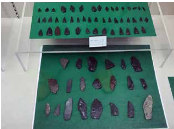
幌倉沼遺跡から出土した石器＝東川町郷土館所蔵

東川や旭川周辺でマンモスの化石は発掘されていないものの、東川町との境界からわずか300mほどの倉沼2遺跡に石器を残したのは、そんな時代を生きていた人たちだ。