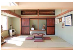
▲展示室…展示のほか、会議室としても利用できます。

東川村(当時)出身。富山県から東川村へ集団入植した農家に生まれた。農業者として稲作をしながら、夜間や農閑期にのみを振るい「農民彫刻家」と呼ばれる。木彫、粘土彫刻、石彫に至るまで、力強く温かい作品を作り続けた。数々の公募展で多数入選、平成16年北海道文化賞受賞。