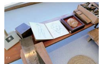
▲収蔵庫には制作の作業風景を再現したコーナーも。