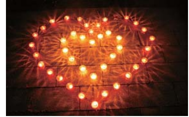
▲永楽寺さんの屋外で焼くキャンドル

蝋燭キャンドル（台紙には心温まるメッセージ入り）の無料配布を拡大し、今年は実に町内700世帯、70事業所、15の公共施設にご協力・ご参加いただきました。みなさんがそれぞれの場所で、思い思いに飾り付けて灯したキャンドルの炎が、町内のいたるところでゆらめきました。幻想的な夏至の雰囲気を楽しもうとお散歩に出かけた方も多かったよう