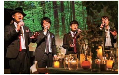
▲コエヨキカセテのアカベラコンサート

6月19日～21日の3日間、「東川8425人のキャンドルナイト」を行いました。昨年好評だったフローティングキャンドルとJampo（ジャンプ）さん監修の蜜