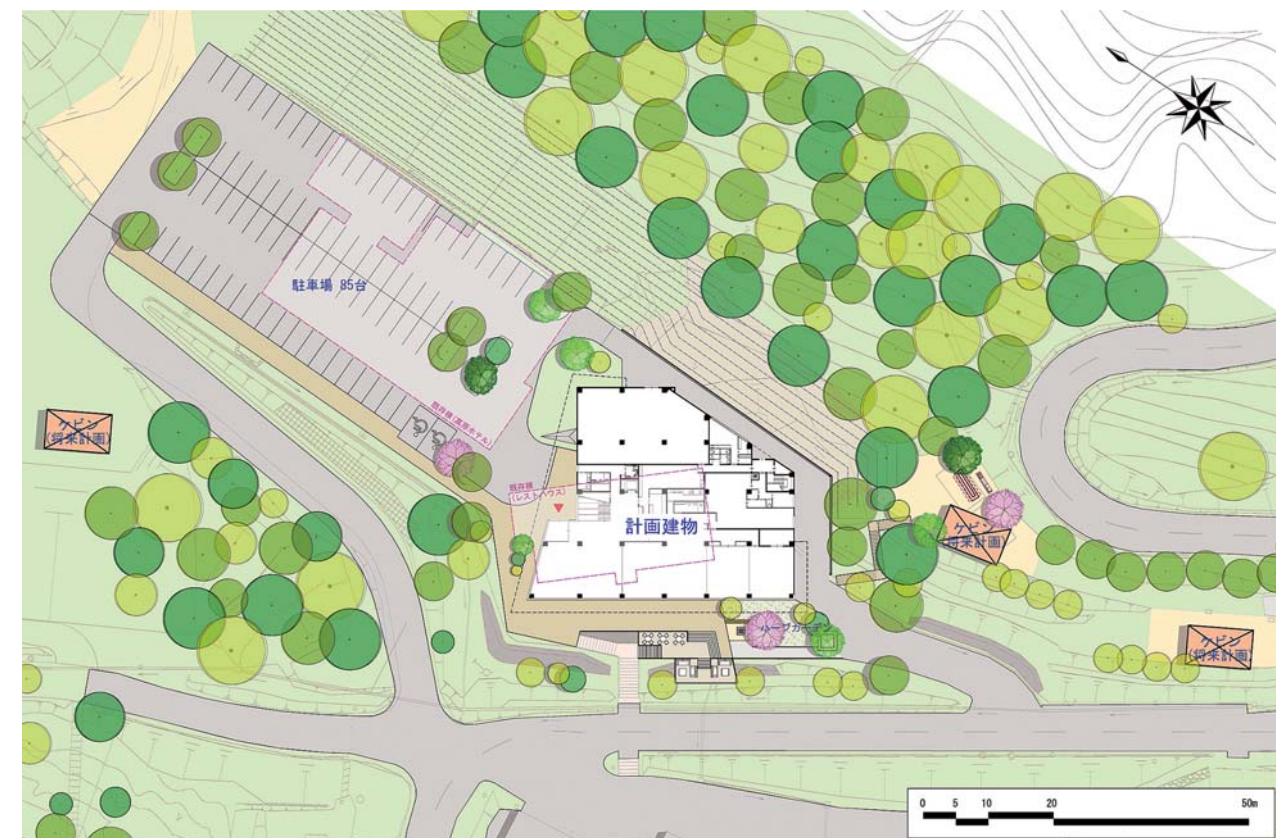
▲配置計画図 現レストランの場所に施設を整備し、現ホテルの場所に駐車場を整備する計画です。宿泊機能は今後建設するケビンとの連動性を高める予定です。

今後は実施設計と並行して、施設機能などの詳細、運営ソフト面を中心に10月の検討委員会を最終として、更に検討を進める予定です。