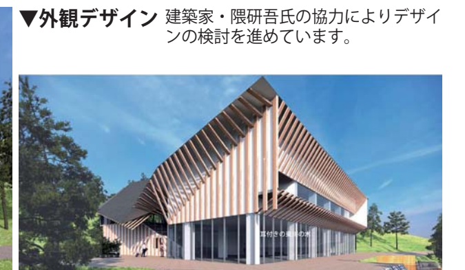
人々をやさしく迎える山脈屋根