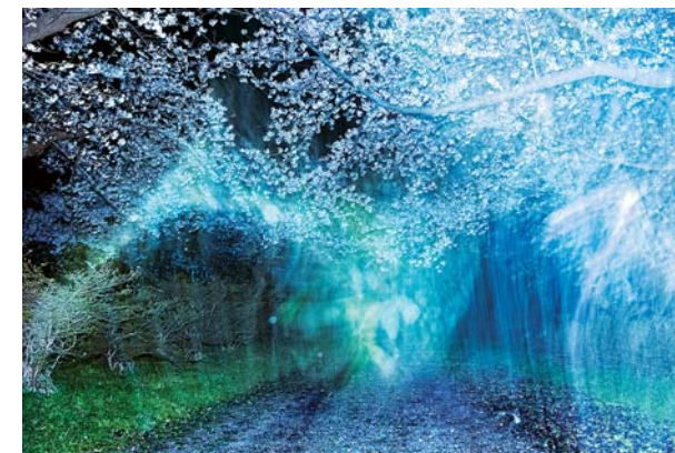
A NEW RIVERより/Tenshochi,Kitakami,Iwate/2020