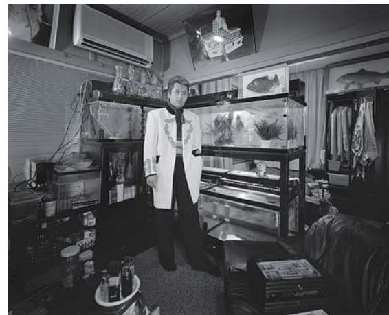
「部屋 Living Room,Tokyo」より/1989-1994