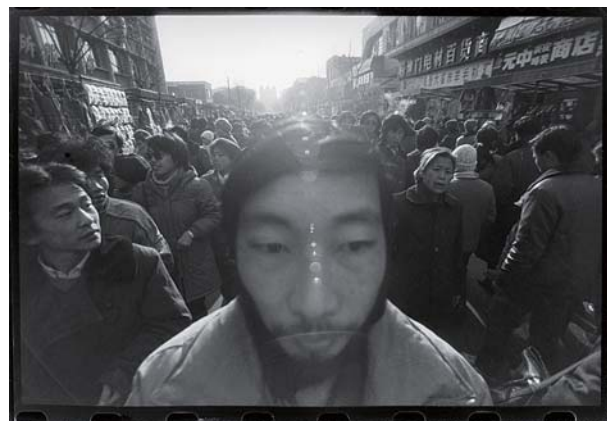
「1m-私の後ろの風景」より/ 1988

受賞理由: 『1m、私の後ろの風景』(1989年)、『私は犬だ』(1996年)及び一連の作品に対して