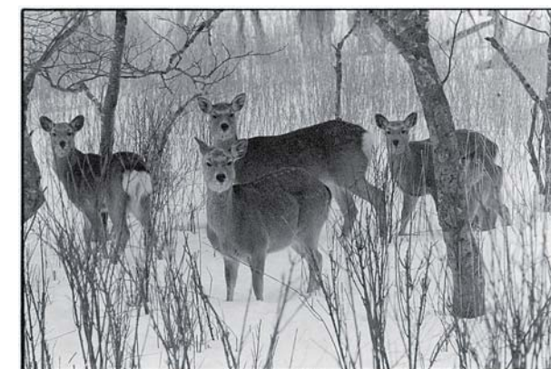
「鹿渡り」より/別海町走古丹/2016