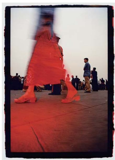
「レッドフラッシュ-Takakoの赤いスカート-北京を歩く」より/2004