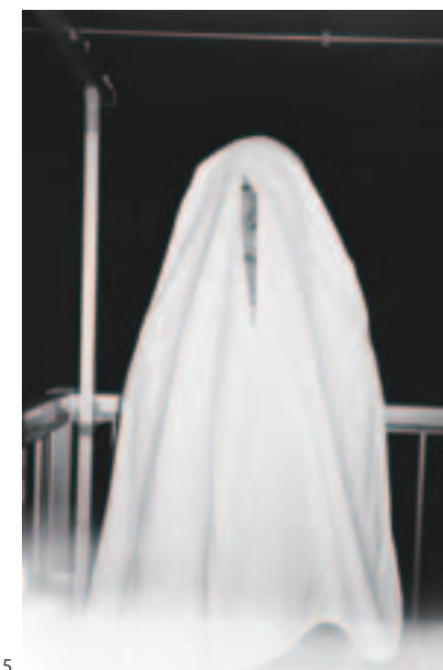
Torn blanket (about home)/2015