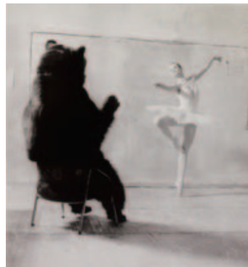
Taste for Russian Ballet from the series "Taste for Russian Ballet",2008