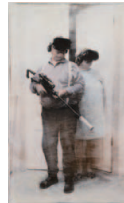
A Retired Couple in Survival Mode from the series "Mixed Reality",2019