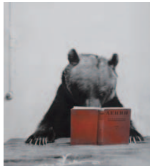
Lenin's Science Makes One's Hands and Mind Stronger from the series "Proverbs",2006

受賞理由: 写真集『Proverbs』(Nazraeli Press/2014)、「Mixed Reality」シリーズ(2018—)及び一連の作品に対して