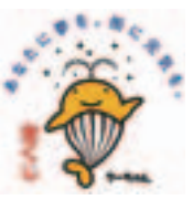
この事業はサマー・ジャンボ宝くじの収益金を活用して実施しています。

昨年12月より、スマートフォン向けの東川町公式アプリを配信しています。(iOS/Android) 現時点では①ごみ出し②ごみの日に通知を受け取る、ごみの分別辞典、ゴミの出し方の確認など ③除排雪情報 ④イベントカレンダー ④避難所マップ の機能を使用することができます。 アプリストアで「東川町」と検索し、ダウンロードしてください。