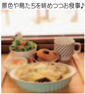
景色や鳥たちを眺めつつお食事♪

ハルキッチンには寒い冬でもあったかくなるメニューがたくさん。ドライカレーのチーズ焼き(1000円)は、道産豚ひき肉をオリジナルスパイスと野菜でじっくり煮込んだドライカレーを、チーズたっぷりで焼き上げたドリア。真ん中にはトロッと卵が入っていてマイルドな味わいです。お惣菜(この日はふるふき大根と豆たつぷりの茶わん蒸し)、サラダ、スープもついてこのお値段。しかもご飯を無料で多めにできます。10日間かけてじっくり作る人気のスモークドチキンランチやホワイトソースのドリア、本日のデザートもオススメです! 店名 ハルキッチン 住所 東11号南4番地 営業 午前11時半～午後4時(4月以降は同5時迄) 定休 (水) (火)は午後3時迄 電話 090-6999210 131