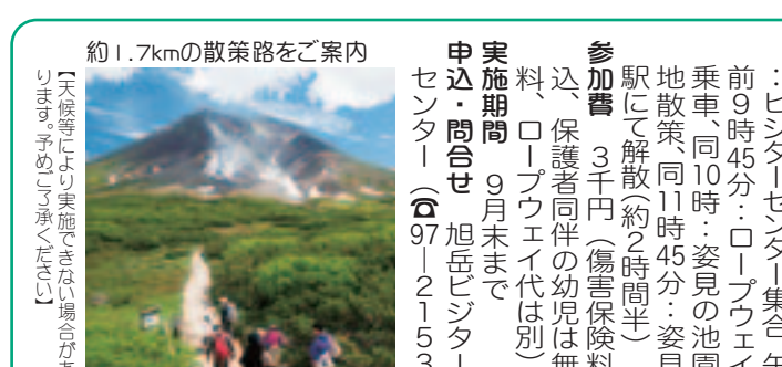
約1.7kmの散策路をご案内

姿見園地をゆく散策 旭岳の姿見園地は、標高千八百という高地ながら、天気が良ければ、旭岳ロープウェイを使って誰でも気軽に行くことができる。道内でも珍しい環境にある高山帯。そんな姿見園地で8～9月に旭岳ビジターセンターが行っているのが「姿見ガイドツアー」。ネイチャーガイドに動植物の解説を聞きながらゆっくり歩くと、新しい発見が待っているはず。この機会に東川の大自然を満喫してみよう！ スケジュール 午前9時15分～：ビジターセンター集合 午前9時45分～：ロープウェイ乗車、同10時：姿見の池園地散策、同11時45分：姿見駅にて解散(約2時間半) 参加費 3千円(傷害保険料込、保護者同伴の幼児は無料、ロープウェイ代は別) 実施期間 9月末まで 申込・問合せ 旭岳ビジターセンター ☎97-2153