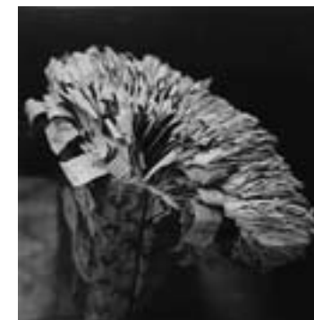
たくさん過ぎるしおりでブロッコリーのように なった『小学国語辞典』を撮影しました。 京都の小学校 2008年

受賞理由 「本の景色/BIBLIOTHECAシリーズ」(ウシマオダ/幻戯書房、2016-2017年)に関する一連の発表に対して