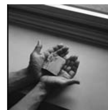
『TIPPENNY-TUPPENNY'S DOLLY BOOK』 英国、子ども向け豆本。 早稲田大学図書館 2004年