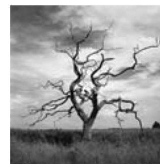
塩水草原の枯れた櫛の木 英国・サフォーク、スネーブモルティングス DEAD OAK ROOTED IN SALINE REED BED Snake Maltings, Suffolk, United Kingdom