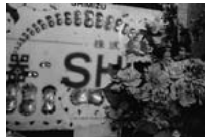
Untitled, 2011 NEROLI Courtesy of Taka Ishii Gallery Photography / Film

受賞理由 写真集『NEROLI』(赤々舎、2016年)、「無垢と経験の写真 日本の新進作家 vol.14」展(東京都写真美術館、2017-2018年)出品作に対して