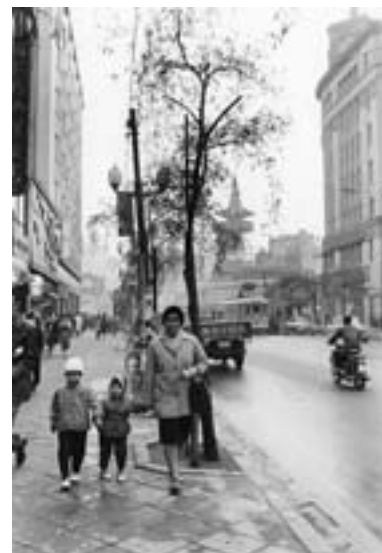
銀座四丁目中央通りを走る都電と柳を背に歩く妻と子どもたち 1961年

受賞理由 写真集『変貌する都市の記録』(白揚社、2017年)ほか、東京を定点観測で撮影し続けてきた活動に対して