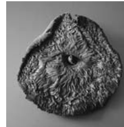
唐傘茸(学名Macrolepiota procera) 英国・サフォークの道路(A1095)脇で発見 PARASOL MUSHROOM (macrolepiota procera) Found by the roadside (A1095) in Suffolk, UK

受賞理由 「Radial Systems」(2017年)シリーズほか一連の作品に対して