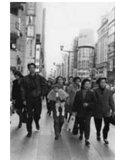
銀座四丁目を背に歩く娘夫婦と孫 1993年