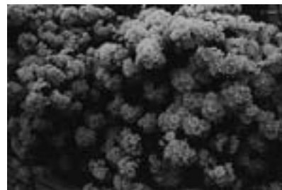
Untitled, 2013 NEROLI Photography / Film