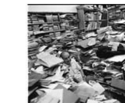
店内は本の海のように、 その底に店主が満足気に沈んでいました。 古書店アドニス内と店主・宮脇忠彦 2003年