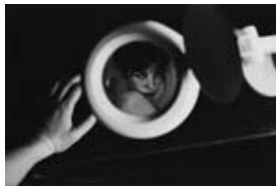
Untitled, 2013 NEROLI Courtesy of Taka Ishii Gallery Photography / Film