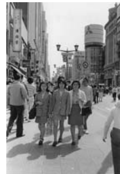
円筒形ガラス張りの三菱ビルを背景に華やかになった銀座中央通り 1975年