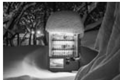
北海道札幌市豊平区 2016年12月 (Roadside Lights シリーズより)