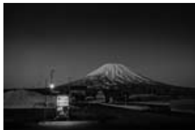
北海道倶知安町 2017年4月 (Roadside Lights シリーズより)

受賞理由 「Roadside Lights」シリーズ(2010-)及び「Being there」シリーズ(2008-)に対して