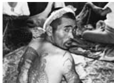
背中一面に竜の影り物をした迫力あるフナガタ 『九十九里浜』より 1963年頃