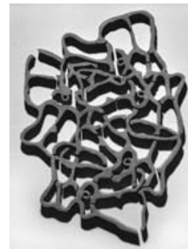
Hedge Maze (Winckler's garden), 2016