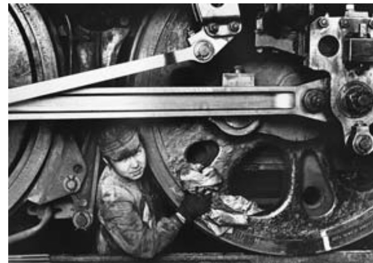
『国鉄蒸気機関区の記録』より 1960年代後半