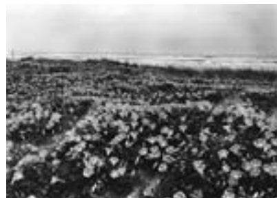
栢田浜(野栄町) 浜屋顔の群生 『九十九里浜』より 1980年頃