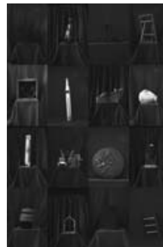
Discarded sculptures (dark pink), 2016