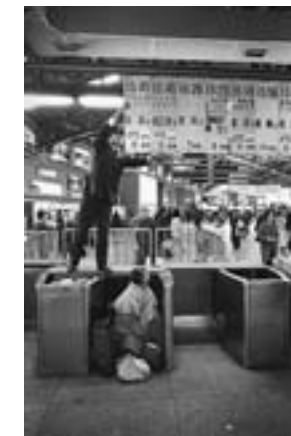
上野駅 / 上野駅、東京 1981年 Ueno Station, Tokyo, 1981