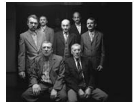
The group portrait, 2011 from the series "Leakage"