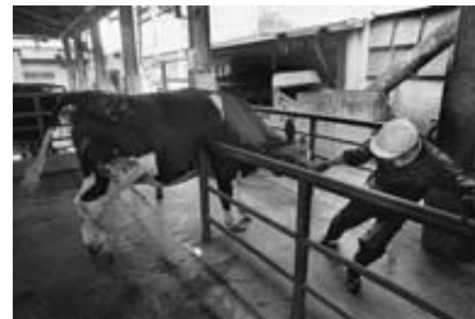
屠場(とば) / 松原、大阪 1986年 Slaughterhouse, Matsubara, Osaka, 1986