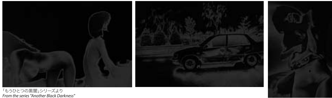
「もうひとつの黒闇」シリーズより From the series "Another Black Darkness"