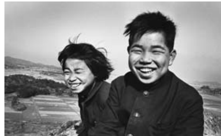
炭鉱(ヤマ) / 鞍手、福岡 1965年 The Coal Mine, Kurate, Fukuoka, 1965