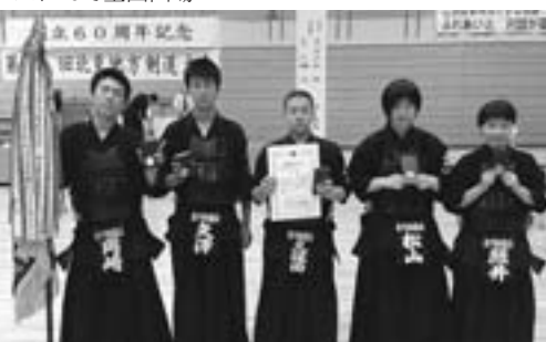
東川剣龍会、北見地方剣道大会で優勝

になりました。今までの警報発表基準をはるかに超える異常な現象が予想され、重大な災害の起こる恐れが著しく大きい場合、特別な警戒を呼びかけるための警報を発表します。「特別警報」が発表される場合は、お住まいの地域はこれまでに経験したことがないような非常に危険な状況です。屋外の状況や避難指示、勧告に留意し、直ちに命を守るために最善の行動をとってください。