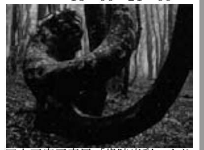
田上正富写真展「歳時光彩」より

文化ギャラリー展示案内 ●7月28日(土)～8月28日(火) ☆第23回東川賞受賞作家作品展 ☆写真インディペンデンス展 ☆ひがしかわこども写真展 （7/28～7/29 2日間のみ入館無料） 開館時間：10：00～17：30 展示最終日のみ15：00で閉館 7/28はイベント期間のため15：00～21：00