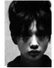
加賀まりこ さん

●6月21日（木）～7月4日（水） ☆第11回日韓写真交流展 ☆石黒健治写真展 「若き獅子たちよ！60-70年 代の肖像」