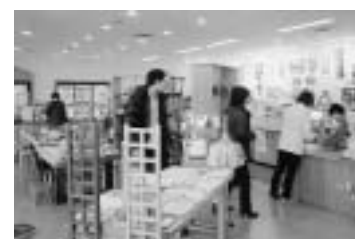
本文と写真は関係ありません

ある日、韓国の団体客がいらした時、皆が皆、500mlペットボトルのCCレモンを買つて行つた時がありました。始めは不思議には思わなかったのですが、皆が同じ物を購入して行つたのには、驚きました。(即完売)