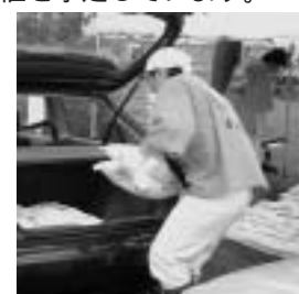
昨年の新米のキャンペーン