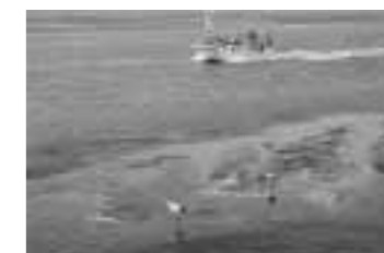
前沢卓写真展より「タンチョウと漁船」