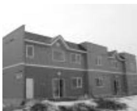
北町5丁目「エーコーカサレリア」 平成16年3月完成(平成15年度事業)