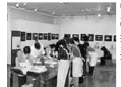
昨年の町民総合文化祭