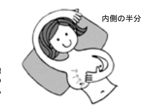
③あおむけに寝て、右の乳房を調べるときは右肩の下に座布団か薄い枕を敷き、乳房が胸の上に平均に広がるようにします。 ④乳房の内側半分を調べるには、右腕を頭のうしろに上げ、左手の指の腹でまんべんなく、軽く圧迫して、ていねいに触る。

マンモグラフィーの併用検診をお勧めしていきます。 30代の検診について 30代は乳腺が最も発達している時期で乳腺密度が高くマンモグラフィーによる診断が難しいとされています。従って視触診のみの検診となり、国の視診では30代は対象外となります。視触診検診のみでは死亡率減少効果が少ないためです。