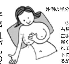
⑤外側半分を調べるには、右腕を自然の位置に下げ、左手の指の腹でまんべんなく、軽く圧迫して、ていねいに触れてみます。最後にわきの下に手を入れて、シコリがあるかどうか触れてみます。 ⑦同じ要領で左の乳房を検査します。 ⑧最後に左右の乳房を軽くつまみ、乳をしぼり出すようにして、血のような異常な分泌物が出ないかを調べます。