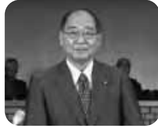
八 毅 峰 長