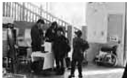
つかみ取抽選(道草館)

約2億8300万円を追加し、総額を約45億7181万円としました。定額給付金事業に約1億3270万円、給付金約1億2269万円と交付にかかる経費などで