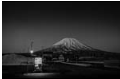
北海道倶知安町 2017年4月 (Roadside Lights シリーズより)

受賞理由 「Roadside Lights」シリーズ(2010-)及び「Being there」シリーズ(2008-)に対して