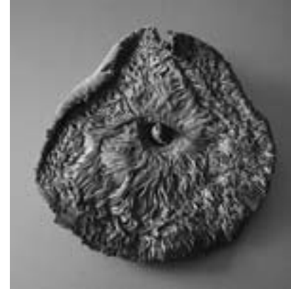
唐傘茸(学名Macrolepiota procera) 英国・サフォークの道路(A1095)脇で発見 PARASOL MUSHROOM (macrolepiota procera) Found by the roadside (A1095) in Suffolk, UK

受賞理由 「Radial Systems」(2017年)シリーズほか一連の作品に対して