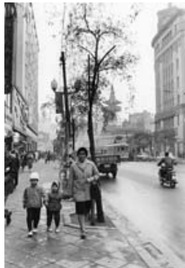
銀座四丁目中央通りを走る都電と柳を背に歩く妻と子どもたち 1961年

受賞理由 写真集『変貌する都市の記録』(白揚社、2017年)ほか、東京を定点観測で撮影し続けてきた活動に対して