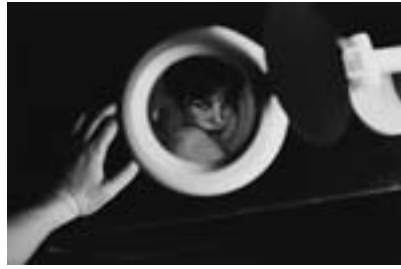
Untitled, 2013 NEROLI Photography / Film