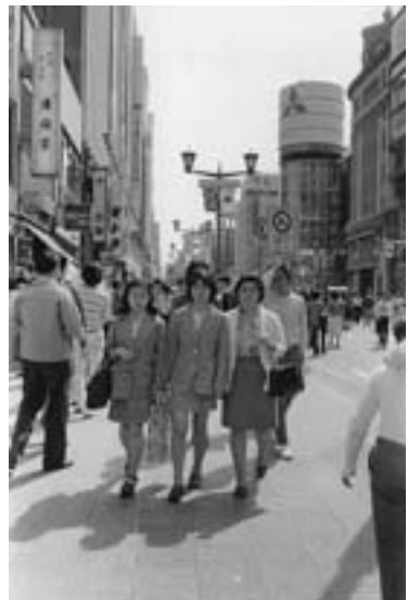
円筒形ガラス張りの三菱ビルを背景に華やかになった銀座中央通り 1975年