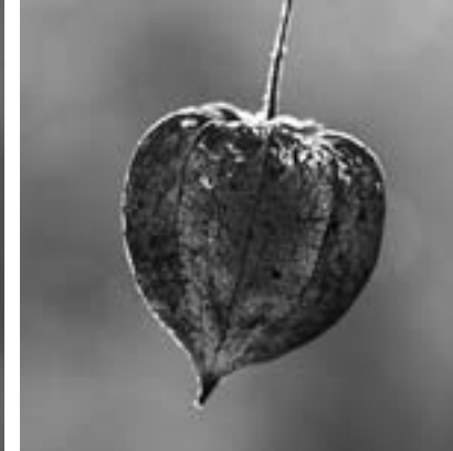
提灯、ほおずき(学名physalis alkekengi) バンクーバー、キツラノガーデンで発見 JAPANESE LANTERN, Chinese Lantern, bladder cherry (physalis alkekengi) Found in a Kitsilano garden, Vancouver