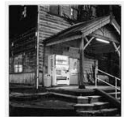
滋賀県東近江市八日市 2015年10月 (Being There シリーズより)