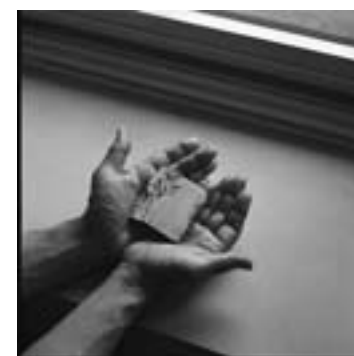
『TIPPENNY-TUPPENNY'S DOLLY BOOK』 英国、子ども向け豆本。 早稲田大学図書館 2004年