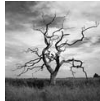
塩水草原の枯れた櫛の木 英国・サフォーク、スネーブモルティンクス DEAD OAK ROOTED IN SALINE REED BED Snake Maltings, Suffolk, United Kingdom