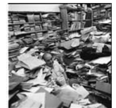
店内は本の海のように、 その底に店主が満足気に沈んでいました。 古書店アドニス内と店主・宮脇忠彦 2003年