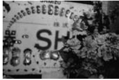
Untitled, 2011 NEROLI Photography / Film

受賞理由 写真集『NEROLI』(赤々舎、2016年)、「無垢と経験の写真 日本の新進作家 vol.14」展(東京都写真美術館、2017-2018年)出品作に対して