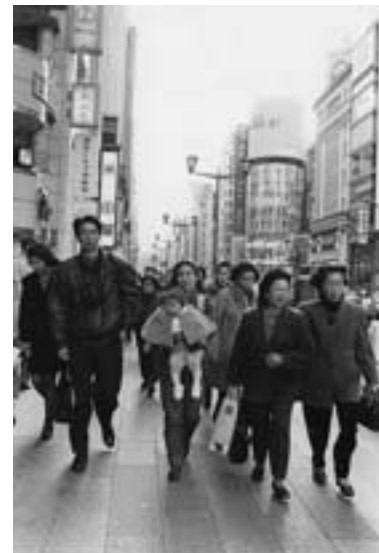
銀座四丁目を背に歩く娘夫婦と孫 1993年