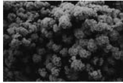
Untitled, 2013 NEROLI Photography / Film