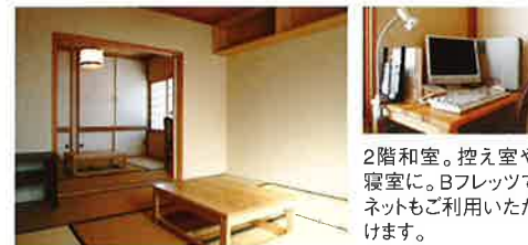
2階和室。控え室や寝室に。Bフレットでネットもご利用いただけます。

自炊型の宿泊も可能で、コンサートの控え室としても利用できる和・洋室をはじめ、バス、洗面台、キッチンなどの生活設備は全て整っております。徒歩で行ける範囲に居酒屋をはじめ飲食店も充実。【宿泊設備】1階/○和室○洋室○キッチン(冷蔵庫、電子レンジ、炊飯器、その他調理用品食器等)、○バス○トイレ○洗面台○洗濯機○地デジ対応テレビ○管球式オーディオ(アンプ、レコードプレーヤー、スピーカー)・2階/○和室○トイレ